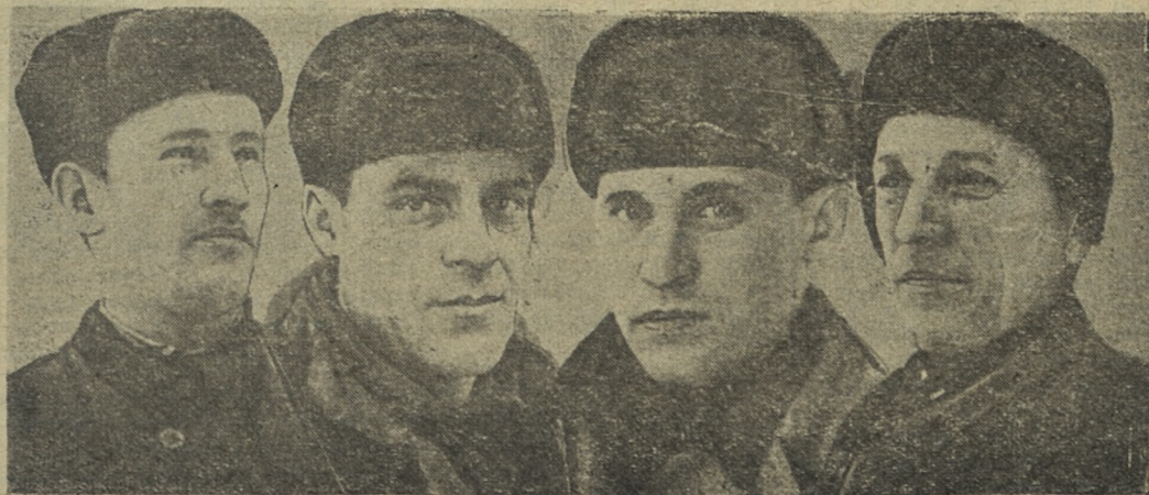
Текст и фото Ю. Замощникова.

Полтора года в школе № 15 не смолкала музыка, смех, песни.