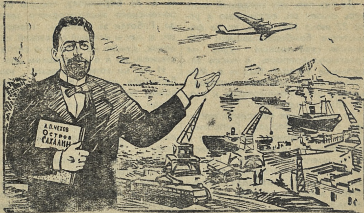
Рис. В. Жарикова.