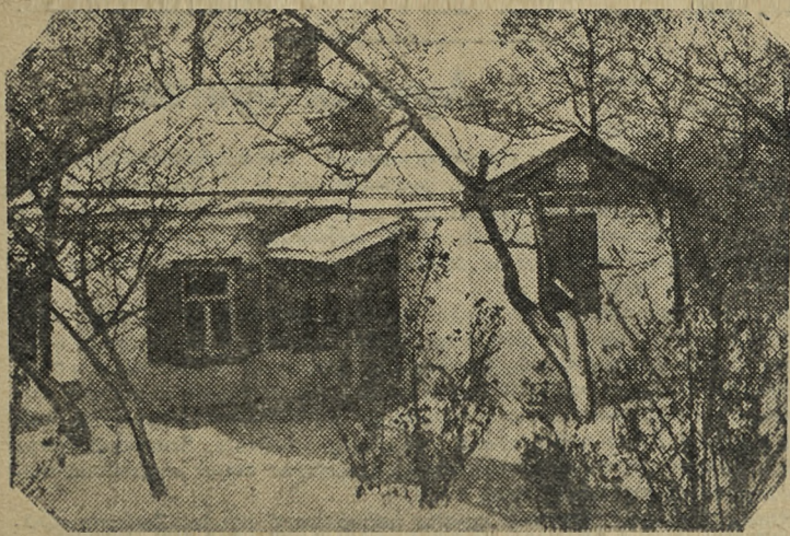
Дом в Таганроге, где родился А. П. Чехов. Ныне дом-музей А. П. Чехова.