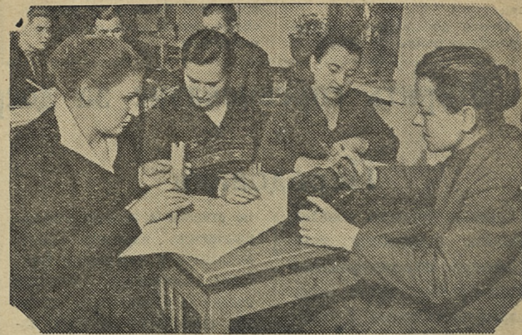
БРЯНСКАЯ ОБЛАСТЬ. Колхозы Дубровского района развернули борьбу за строгий режим экономии, за бережливое расходование средств, за снижение себестоимости сельскохозяйственной продукции.

Большое внимание уделяется планированию сельскохозяйственного производства. Руководящие кадры колхозов, специалисты и счетные работники изучают вопросы конкретной экономики колхозного производства.