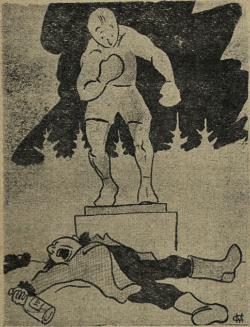
Случай на стадионе.