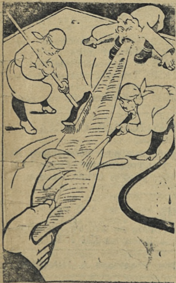
Санобработка сквернослота. Рис. А. Зубова.

«ПОД ЗНАМЕНЕМ ЛЕНИНА» 6 января 1960 г. 3 стр.