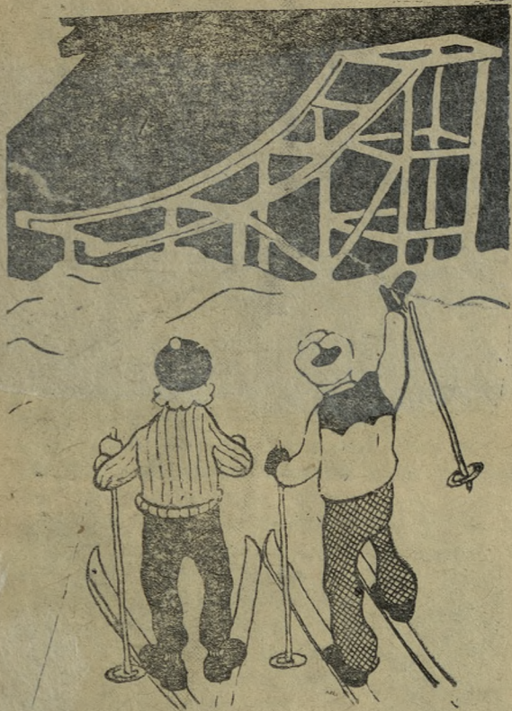
Рис. М. Скатица.

Может быть, давно все было это, Но о цехе я таком мечтал, Где бы пол надраенным паркетом Мне под ноги весело бежал, Был бы зал не меньше стадиона, Ярче солнца рассыпался свет, Чтоб железо музыкой стозвонной Цело гимн величию наших лет. А со стен бы возгласы плакатов Шли призывом к людям молодым: «МАСТЕРА ХОЛОДНОГО ПРОКАТА, БОЛЬШЕ ТРУБ СТРАНЕ СВОЕЙ ДАДИМ!» И мечта моя не скрылась в Лета — В красоте труда воплощена. Светлой Былью ходит по паркету, Чистотой любуетсся она. Здесь в углу не спрячется окурок, Не войдет неряшливость сюда. Цех — не клуб и не дворец культуры, Но — дворец культуры труда.