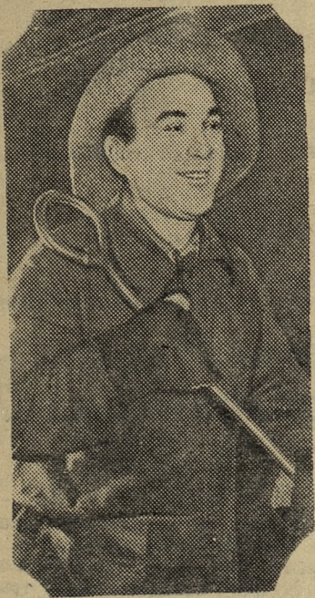
Мурманская область. Коллектив Кандалакшского алюминиевого завода перевыполнил план деся-

ти месяцев по выпуску металла и благодаря снижению себестоимости продукции сэкономил более двух миллионов рублей. Выдано металла высших сортов 95,5 процента вместо 90 процентов по плану.