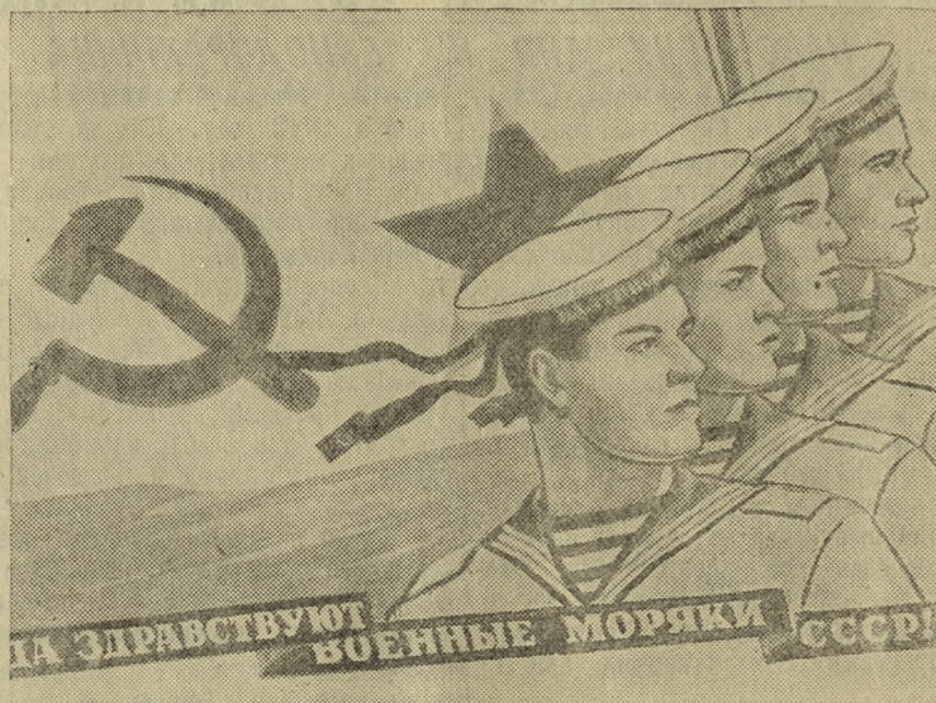
Плакат работы художника Кокорекина, выпущенный издательством «Искусство».

Слава Военно-Морскому Флоту СССР, бдительно охраняющему завоеванный мир и созидательный труд советского народа!