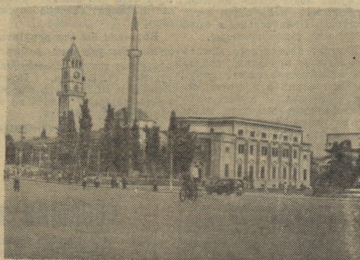
Народная Республика Албания. Площадь Скандерберга в Тиране.

Год еще не кончился, а еще многие подлечат свое здоровье в здравницах страны.