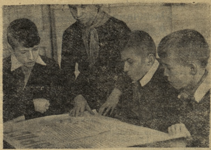
Любят в средней школе № 15

учащиеся свою газету «Пионер». В ней интересно рассказывается о жизни звеньев, дружины. Едко высмеиваются и недостатки. Чтобы газета привлекала внимание ребят, над ее выпуском много приходится потрудиться редколлегии.