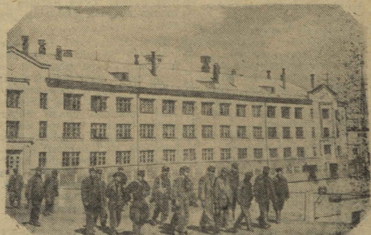
Южно-Казахстанская область. Замечательных трудовых успехов добился коллектив шахты «Западная» Ачисайского полиметаллического комбината. Десятимесячная программа по добыче руды выполнена на 109,4 процента. Горняки шахты «Западная» добыли десятки тонн свинцовой руды сверх плана. На снимке: горняки шахты «Западная» после трудовой вахты.

раз пересекает стальную магистраль. Он должен пройти через реки Ояш, Лебяжья, Томь, Сосновка и другие. Путь строителям преграждают десятки грубых оврагов, многокилометровая полоса болот, глухая тайга, по которой не ступала нога человека.