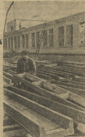
ЛАТВИЙСКАЯ ССР. В этом году межколхозные строительные организации, созданные в 40 сельских районах, произведут работ почти на 80 миллионов рублей.

Нужно в корне изменить отношение руководителей к нуждам застройщиков, ежедневно помогать им материалами, транспортом. Партийным организациям надо вести постоянный контроль за деятельностью администрации и строго требовать с тех, кто мало интересуется тем, чтобы в нашем городе каждый год строить все больше и больше жилья для трудящихся.