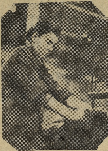
Трудящиеся Албании раз- вернули социалистическое соревнование в честь испол- няющейся 29 ноября 15-й го- довщины освобождения стра-