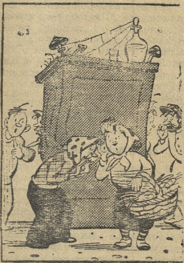
У забытой трибуны.

В Новоуткинске слабо поставлена атеистическая пропаганда, нет лекций на темы достижений советской науки и техники. В результате недостаточной политико-массовой работы с населением в поселке свили себе гнездо реакционные сектанты-иеговисты.