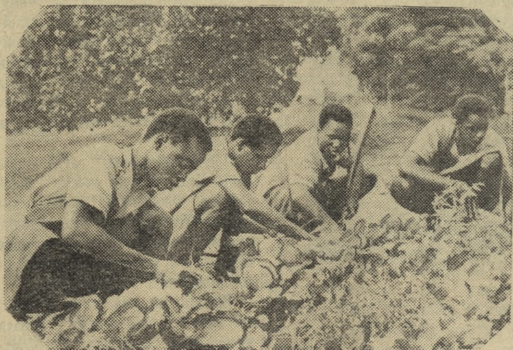
Гвинейская Республика. Учащиеся сельскохозяйственной школы близ Маму на занятиях.