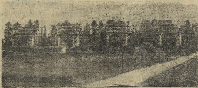
Современные ступенчатые дома в Швеции.

Плата за жилплощадь в Швеции огромна. Чтобы получить квартиру от государства, рабочий должен внести 6 тысяч крон и затем ежемесячно выплачивать 200 крон, причем средний заработок рабочего в легкой промышленности, напри-