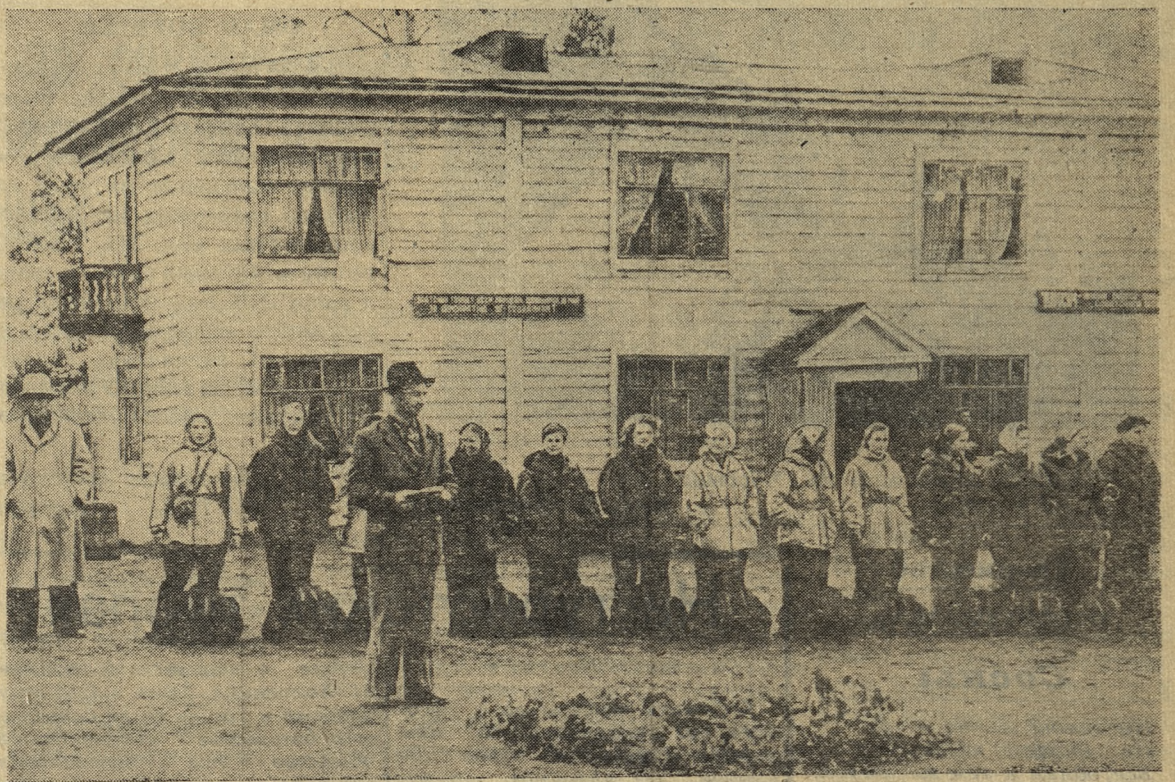
В ПОХОД ГОТОВЫ!