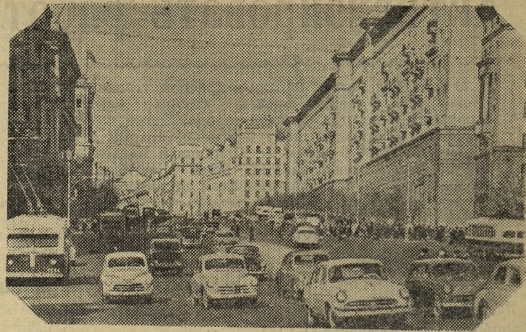
Москва сегодня. Улица Горького.

Не справились с программой первый и пятый трубопрокатные, третий и шестой трубоболочильные цехи. Далеко отстали от передовых труженики баллонного цеха и цеха «В-4». Коллективам этих цехов надо подтянуться.