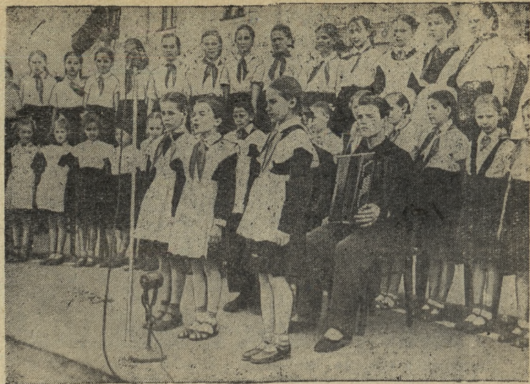
Дворец культуры Динасового завода. Пионерский ансамбль песни и пляски.

Большая и разносторонняя деятельность Одесского Дома атеиста служит важным делу научно-атеистической пропаганды, коммунистическому воспитанию трудящихся.