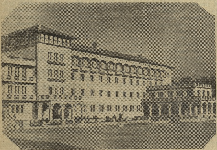
Народная Республика Болгария. Новый дом отдыха для крестьян в Костендиле.

рального статистического управления, опубликованным в печати, население Индии в настоящее время составляет 415 млн. человек.