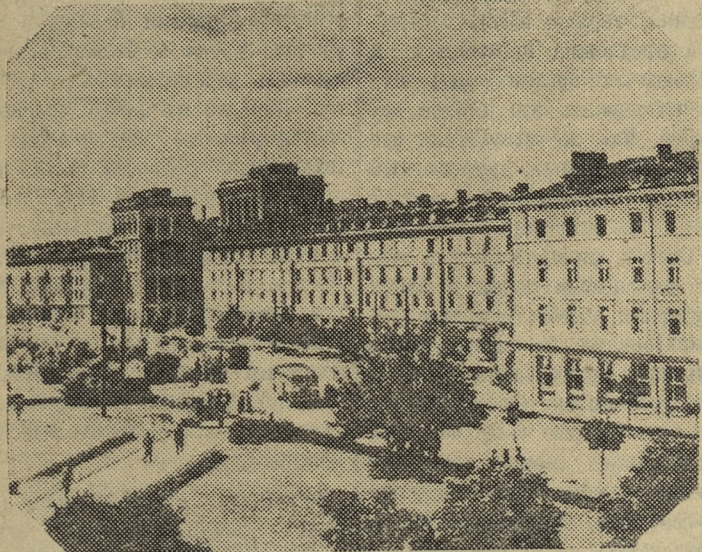
Вверху: Народная Республика Болгария. Кварталы жилых домов в Димитровграде.