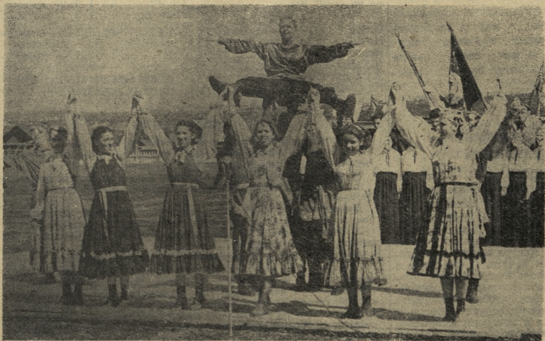
Какие радостные лица у исполнителей русской народной пляски! Невольно и самим зрителям становится весело от их брызжущего веселья, молодости, задора. Это танцевальный коллектив Дворца культуры огнеупорщиков выступает на своем стадионе перед дирижерами.