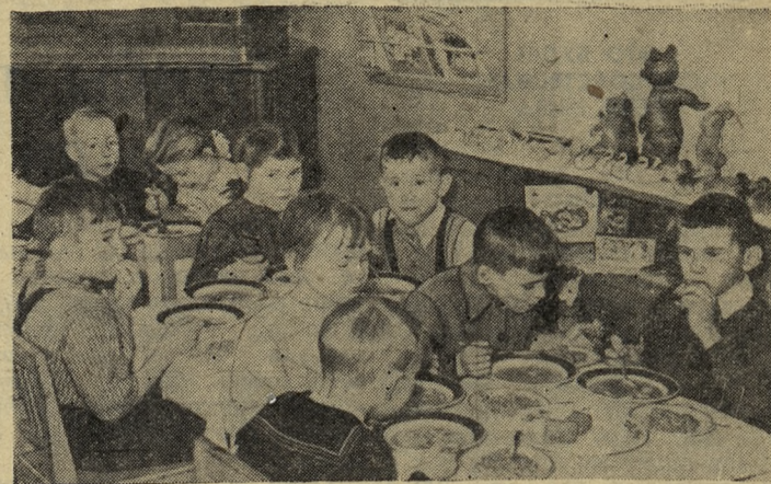
Мало кто из ребятшек, изображенных на снимке, смотрит в сторону фотоаппарата. Гораздо больше в эти минуты их интересует то, что находится в тарелках. Правда, вкусно? Повара постарались... На снимке: обед в детском саду № 15 Динасово-го завода.