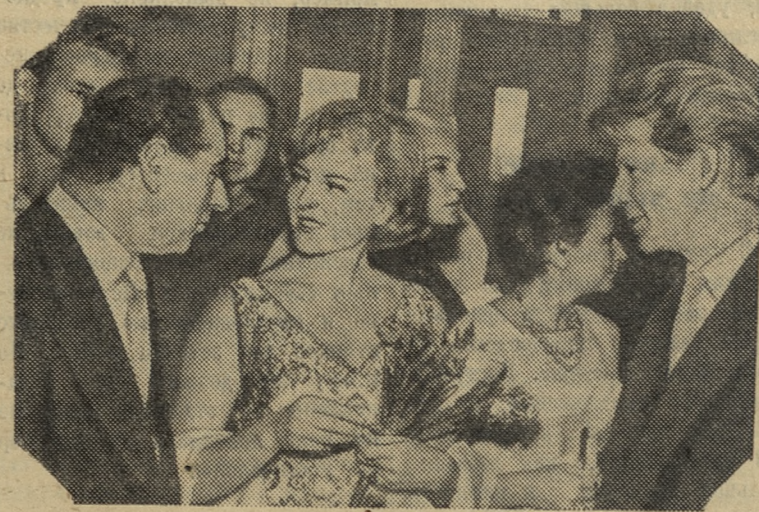
Международный кинофестиваль 17 августа в Москве закончился. Французская киноактриса Николь Курсель, известная советским зрителям по кинокартине «Папа, мама, служанка и я», беседует с продюсером Тушерером и советским киноактером Олегом Стриженовым.

16 АВГУСТА, в Москве, на Центральном стадионе имени В. И. Ленина состоялся праздник, посвященный закрытию Спартакиады народов СССР.