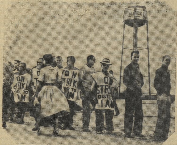
Соединенные Штаты Америки. Недавно объявили забастовку рабочие завода компании «Сессна эйркрафт» в Уичито (штат Канзас).

Печать подчеркивает растущее единство действий всех профсоюзных организаций Франции. Впервые со времени крупных забастовок 1947 года восстанавливается единство в рядах французского рабочего класса. Это является важнейшим фактором для успеха забастовочной борьбы трудящихся Франции. А. БОБРОВСКИЙ.