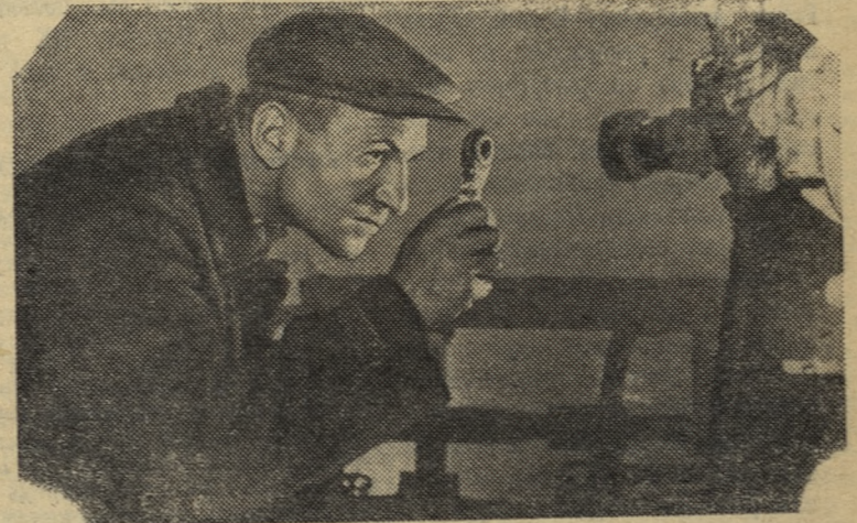
Доменщики Нижне-Тагильского металлургического комбината решили выполнить задание семилетки по выпуску чугуна

ЦК КП Украины принял постановление по поводу патриотического почина инженерно-технических работников коммунистов — начальников передовых участков.