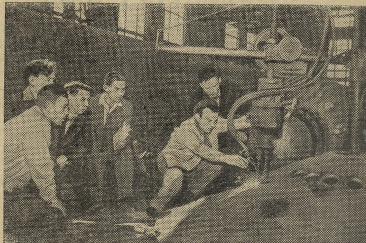
Свердловск. На Уралхиммашзаводе закончила работу межсоюзная школа обмена опытом по сварочному производству в машиностроении. Более 100 сварщиков и технологов из Ленинграда, Харькова, Челябинска, Кирова и районов Свердловской области прослушали лекции специалистов, познакомившись с методами работы лучших электросварщиков завода и новыми электросварочными установками.

На снимке: в цехе тяжелой химической аппаратуры. Установка для механизированной газопламенной вырезки отверстий в конических решетках трубных аппаратов.