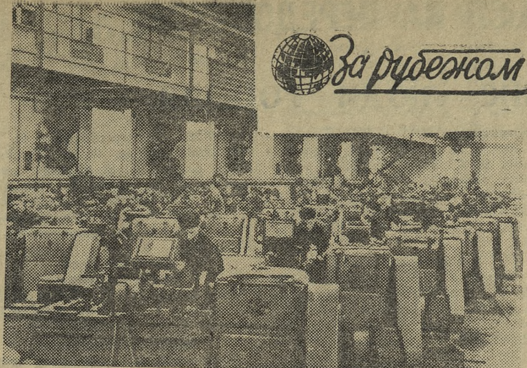
Румынская Народная Республика. Новый инструментальный цех железнодорожных мастерских «Гравица-Роши» в Бухаресте.

В решении этой важной задачи решающая роль принадлежит партийным, комсомольским и профсоюзным организациям, нашей школе, семье и всей ответственности, призванной стоять на страже моральных норм и принципов коммунизма.