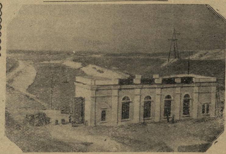
С ФОТОАППАРАТОМ ПО РОДНОЙ СТРАНЕ