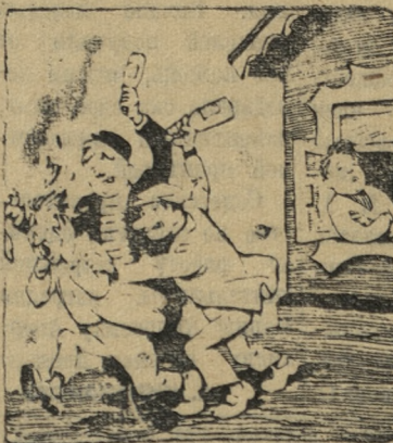
— Мая хата с краю...

Нельзя мириться с теми, кто равнодушно взирает на факты аморальных проявлений и тем самым поощряет нарушителей общественного порядка.