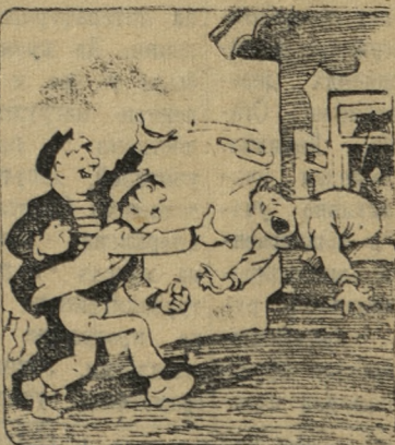
— Выручайте, погибай!