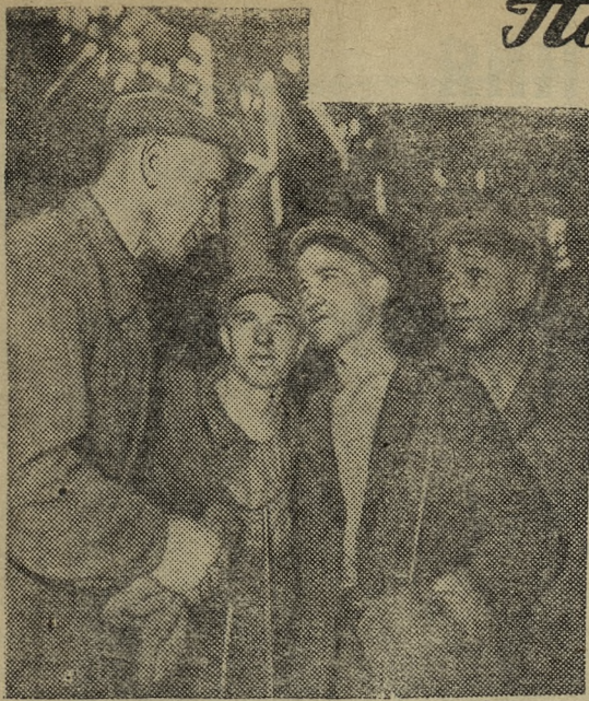
БРИГАДА КОММУНИСТИЧЕСКОГО ТРУДА

Украинская ССР. На Луганском тепловозостроительном за-