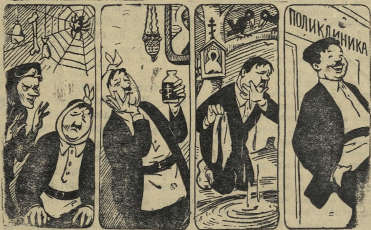
У знахарки заговаривал — не помогло... Крещеной водой полоскал — не помогло... К святому и точнику ходил — не помогло... Пришлось обратиться к последнему средству — пошло!