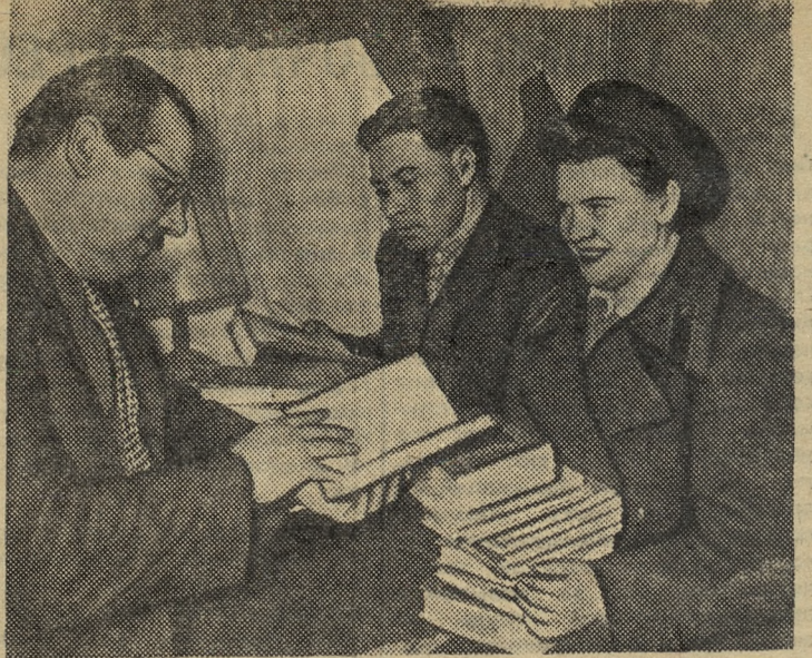
В каждом поезде, формирующемся на Оренбургской железной дороге, один из проводников исполняет общественную обязанность книгоноши.

По мере роста общественного производства, когда будет создано изобилие предметов потребления и труд станет первой жизненной потребностью человека, общество откажется от социалистического принципа распределения по труду и перейдет к коммунистическому принципу распределения по потребностям.