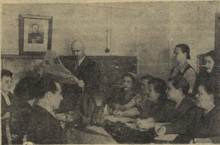
Постановление ЦК КПСС и Совета Министров СССР о дальнейшем улучшении работы предприятий общественного питания вызвало большой интерес трудящихся.

Замечательных успехов в труде добился трикотажный цех артели. Свой квартальный план на это же число коллектив цеха выполнил на 108 процентов, месячный — на 104,9 процента. За квартал цехом выдано сверхплановых трикотажных изделий на 52 тысячи рублей.