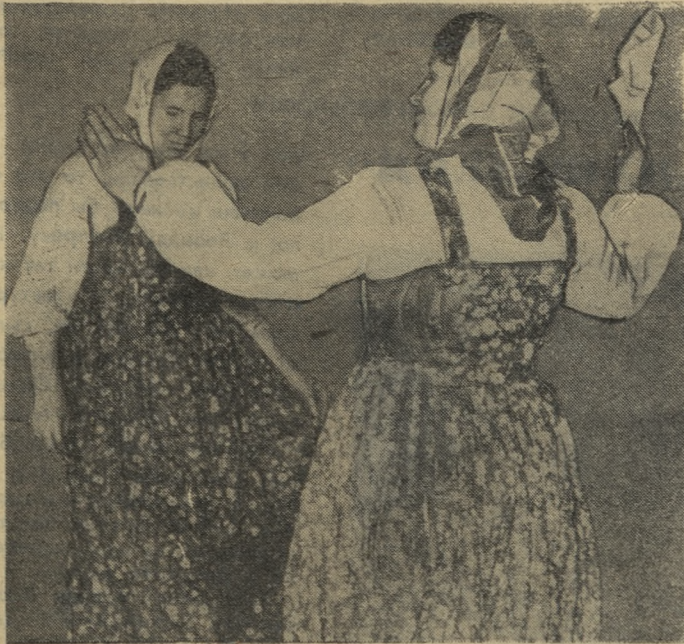
повеселиться наши домохозяйки! На снимке: члены ансамбля исполняют «Русский танец».

Жители области могут увидеть творческий концерт самодеятельности первоуральцев сегодня по телевизору.