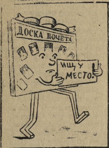
В некоторых цехах Новотрубного завода еще недостаточно хорошо поставлена наглядная агитация.

Советский народ, воодушевленный решениями XXI съезда партии, приступил к выполнению семилетнего плана