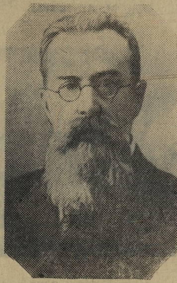
царт и Сальери», «Царская невеста».

Начиная с восьмидесятых годов Римским-Корсаковым написан ряд симфонических произведений, романсы, дуэты, оперы «Ночь перед рождеством» и «Садко», «Мо-