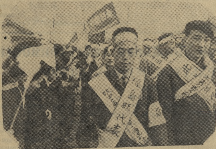
Япония. С юга страны по направлению к Токио движется колонна участников «большого похода» трудящихся против безработицы, в защиту жизненных прав, за мир и демократию, начавшегося в январе этого года в городе Фукуока. На груди участников похода перекрещенные полотнища с лозунгами: «Положить конец политике войны и безработицы», «Утвердить принципы мирного сосуществования».

панию «Рейншталь-Концерн», что на предприятии намечается производство танков. По сообщению газеты «Нейес Дейчланд», на заводе состоялось заседание производственного совета, члены которого протестовали против выпуска военной продукции.