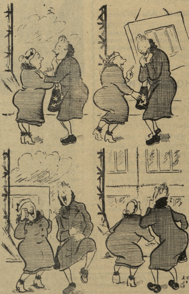
Рис. М. СКАТИНА.