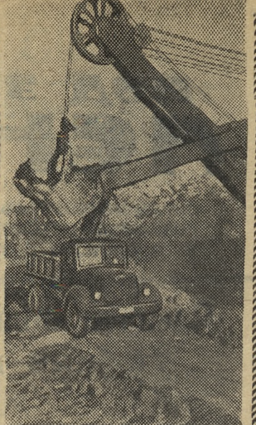
Пермская область. Быстрыми темпами сооружается Воткинская ГЭС. За минувший год строители выполнили почти 10 миллионов кубометров земляных работ, уложили 70 тысяч кубометров бетона и железобетона, смонтировали 2,2 тысячи тонн металлоконструкций. Вдохновленные решениями XXI съезда КПСС, строители стремятся досрочно сдать станцию в эксплуатацию. Задание этого года они решили выполнить к 25 декабря. На снимке: работы в котловане строительства Воткинской ГЭС.