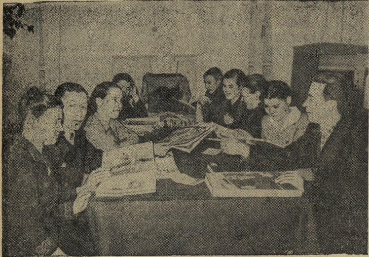
Вот уже несколько лет в здании школы № 8 в дни выборных кампаний партийная организация цеха № 1 НТЗ открывает агитпункт избирательного участка № 30.

На снимке: на агитпункте избирательного участка № 30.