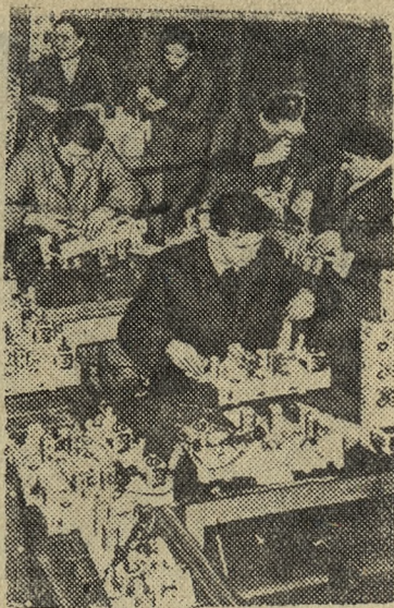
Польская Народная Республика. Рабочие Варшавского радио-завода имени Каспшака в честь предстоящего III съезда Польской Объединенной Рабочей партии взяли обязательство изготовить тысячи радиоприемников новой конструкции сверх плана.

На снимке: в цехе завода.