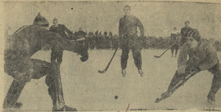
В прошлое воскресенье состоялось открытие зимнего спортивного сезона на стадионе Новотрубного завода. На снимке: Опасный момент у ворот команды НТЗ, созданный хоккеистами СКВО, — чемпионами страны.

Советские предложения по берлинскому вопросу вызвали замешательство официальных кругов в Вашингтоне.