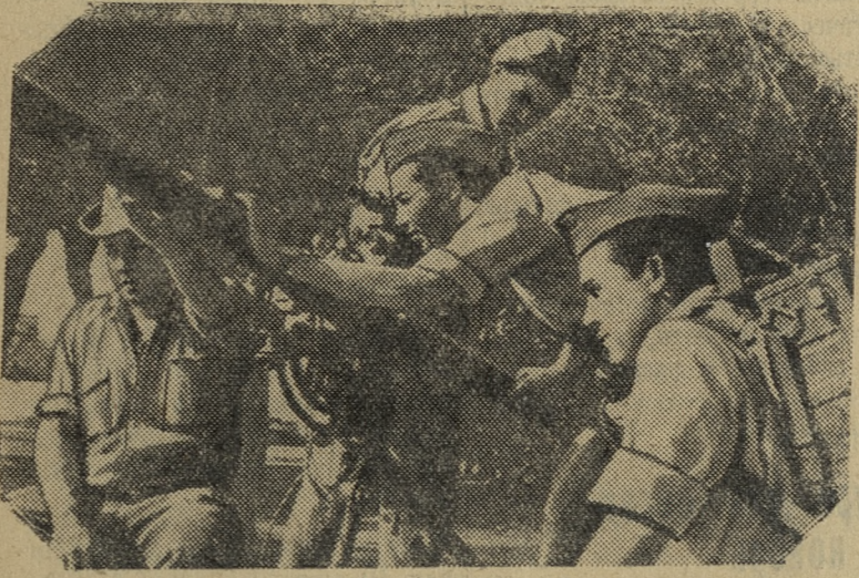
Война в Алжире. Бойцы алжирской Национально-освободительной армии осваивают боевую технику.

В Чили в течение длительного времени действовала американская миссия Клейна-Сакса, которая, под видом разработки программы ослабления инфляции, создавала условия для усиленного проникновения в Чили американского капитала и дальнейшего подчинения экономики страны монополиям США.