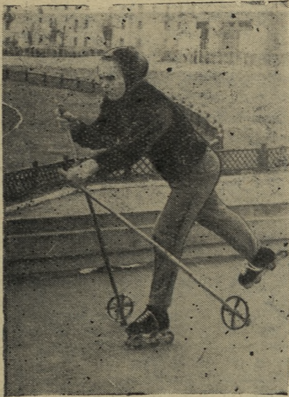
Оказывается и без снега можно тренироваться лыжнику. Роликовыми коньками пользуются спортсмены Новотрубного завода.

Годовой подпиской на газету «Советский патриот» награждены каждый из трех стрелков — юношей, показавших лучшие результаты: Гельфгат, Буренков и Нарбутовских.