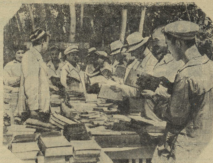
Кашка-Дарьинская область (Узбекская ССР). В ряде колхозов Каршинского района организована продажа книг колхозникам, занятым на полевых работах. Передвижные киоски обкниготорга можно видеть на колхозных улицах и в полевых станах.

На снимке: продажа книг в колхозе имени Сталина.