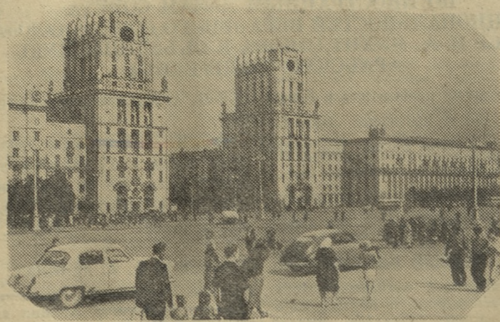
Минск. Привокзальная площадь.