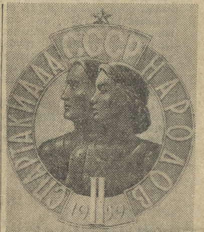
Эмблема II Спартакиады народов СССР, которая состоится в 1959 году.

Участники общегерманской конференции решительно осудили в своем воззвании антикоммунистическую пропаганду и враждебную кампанию против ГДР, которая ведется в Западной Германии. Они приветствуют и поддерживают предложение объединения свободных немецких профсоюзов к объединению профсоюзов Западной Германии, о мирном соревновании между обоими профобъединениями в борьбе за мир и восстановление Германии, за права рабочих и за повышение жизненного уровня трудящихся обеих германских государств.