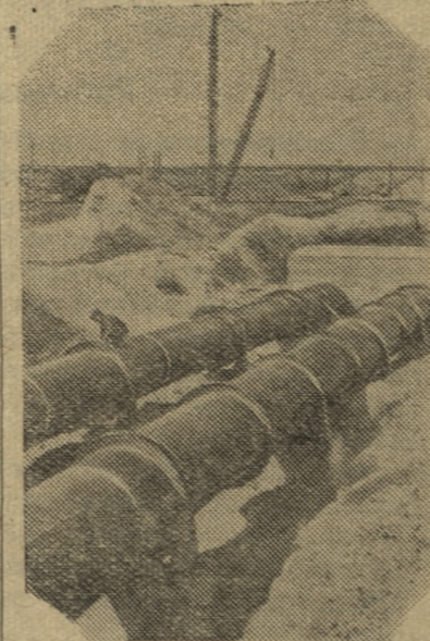
Узбекская ССР. В Голодной степи полным ходом идет ирригационное строительство. В Бригадском районе сооружается насосная станция, которая будет подавать воду из Южного Голодного канала для орошения целинных земель.

АЛМА-АТА, 11 сентября. (ТАСС). Выдал первую продукцию мощный кирпичный завод в городе Джамбуле. Это новое предприятие из 167 крупных пусковых строений Казахстана. В нынешнем году в строй войдет вторая очередь Соколовского рудника, две шахты в Карагандинском угольном бассейне, второй угольный разрез в Экибастуе, цементные заводы в Чимкенте, Семипалатинске и др.