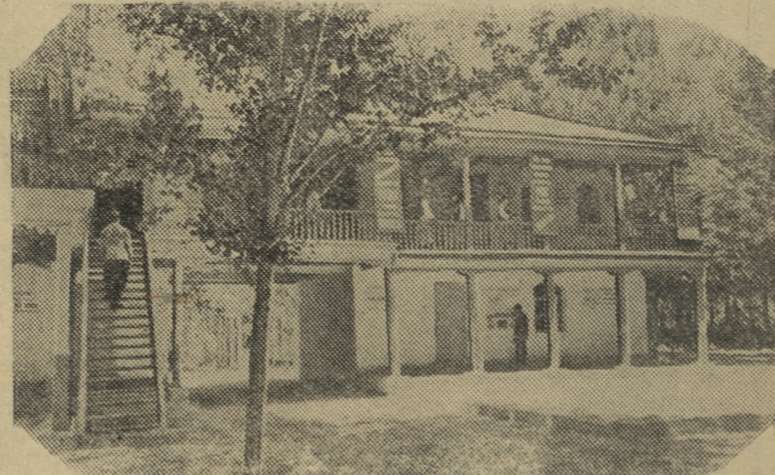
Ферганская область. В сельхозартели имени Ленина Алты-Арыкского района имеются хорошо оборудованные полевые станы. На снимке: полевой стан 10-й бригады колхоза.