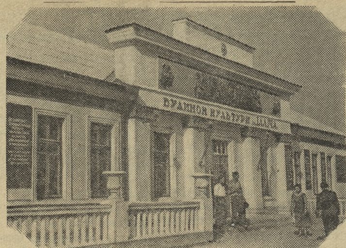
Херсонская область. Скадовский район занял первое место в области по строительству колхозных клубов и Домов культуры.

В сельхозартели «Советская Украина» построен новый Дом культуры имени Ильича со зрительным залом на 450 мест, комнатами для занятий художественной самодеятельности и библиотекой с читальным залом.