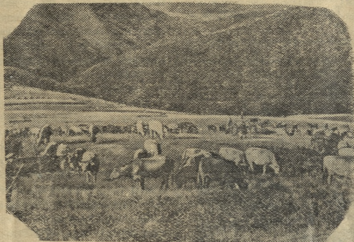
Народная Республика Болгария. На пастбище государственного земледельческого хозяйства имени Диню Дачева близ города Сливен.

спортивных мероприятий школ на первую четверть. В нем предусмотрено проведение в честь 40-летия ВЛКСМ кросса, розыгрыша по волейболу и баскетболу, стрельбе.