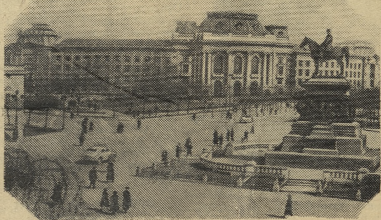
Народная Республика Болгария. Здание Софийского университета на площади Народного Собрания.

«ПОД ЗНАМЕНЕМ ЛЕНИНА» 9 сентября 1958 г. 3 стр.