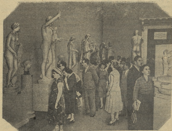
Москва. В Музее изобразительных искусств имени А. С. Пушкина открылась выставка культурных ценностей, принадлежащих музеям и учреждениям Германской Демократической Республики и временно хранившихся в Советском Союзе. Спасенные советскими войсками в дни Великой Отечественной войны, во время боев, проходивших на территории Германии, эти сокровища искусства по решению Совета Министров СССР передаются правительству ГДР.

Другие представители ревизионизма, не решаясь открыто выступать против самого существования партии, весь огонь своей критики направляют против руководящей роли партии в рабочем движении, против ее организационных основ — демократического централизма. Такими замаскированными лик-