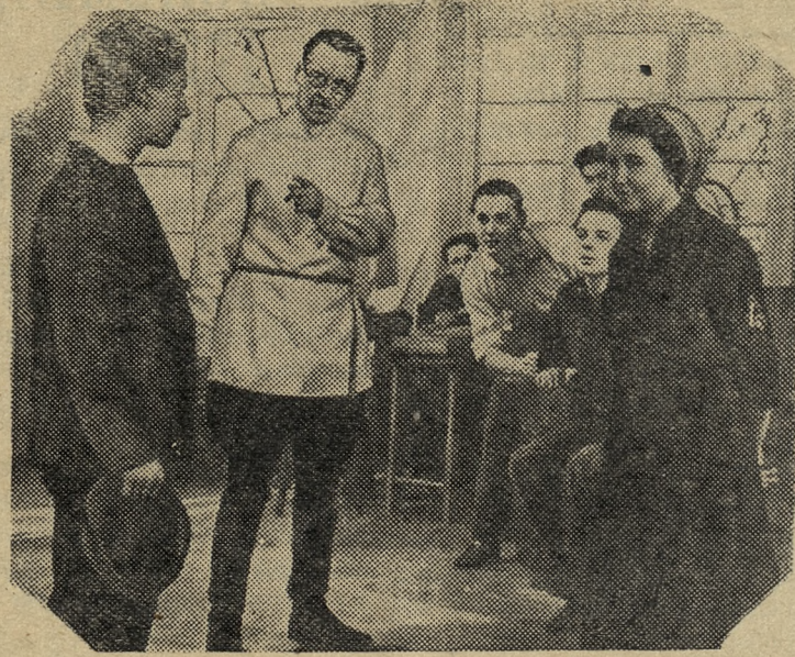
На экранах страны демонстрируется новый художественный фильм «Флаги на башнях», выпущенный Киевской киностудией.

Женевская выставка по мирному использованию атомной энергии продлится до 15 сентября.