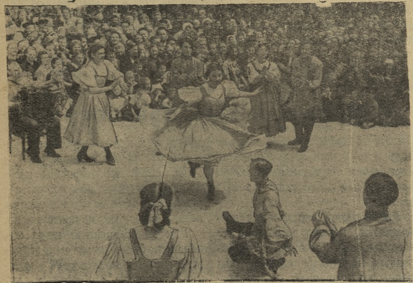
После выступления хора начался большой концерт. Зрители окружили эстраду, где в веселом вихре кружатся танцоры. Задорную пляску исполняют молодые новотрубники.

Затем идут участники танцевальных коллективов из всех клубов, одетые в танцевальные