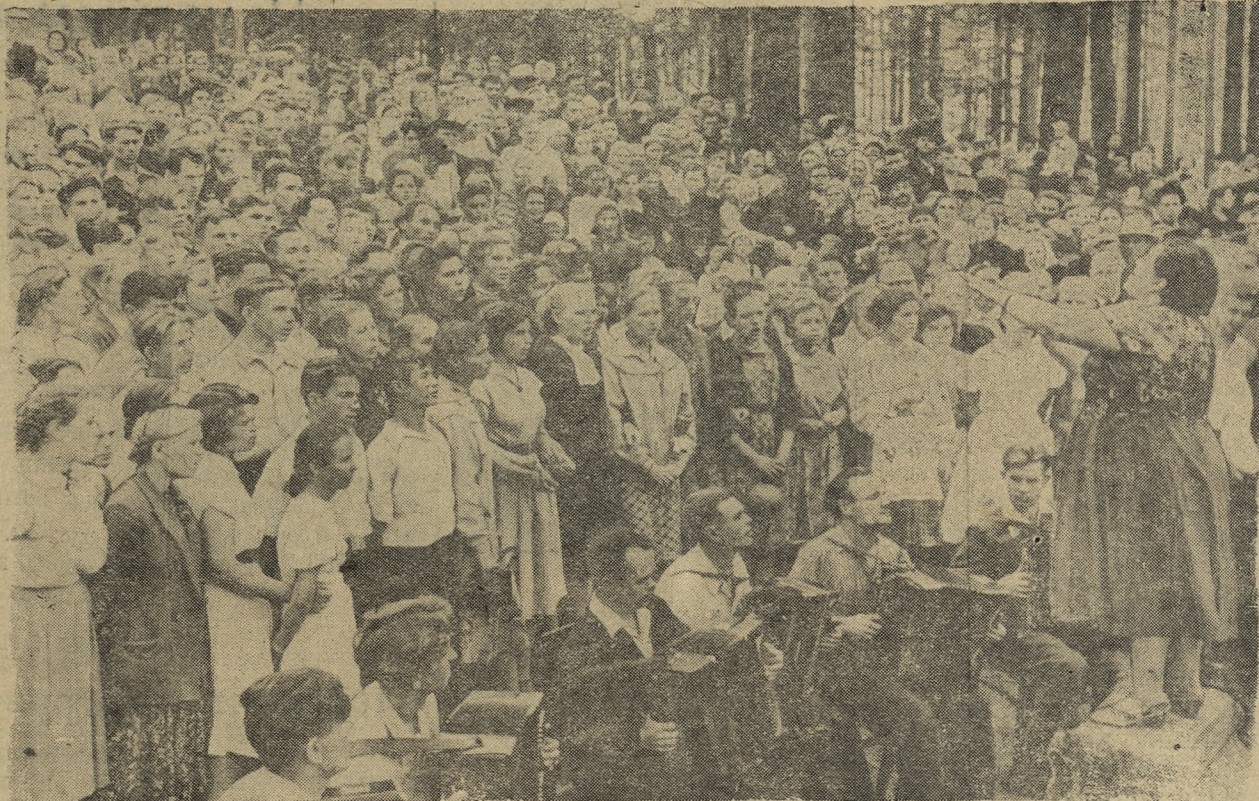
29 июня в Первоуральске проходил городской Праздник песни. Посмотрите, с каким увлечением поет молодежь. И песню эту подхватывают все, стоящие рядом с хором.