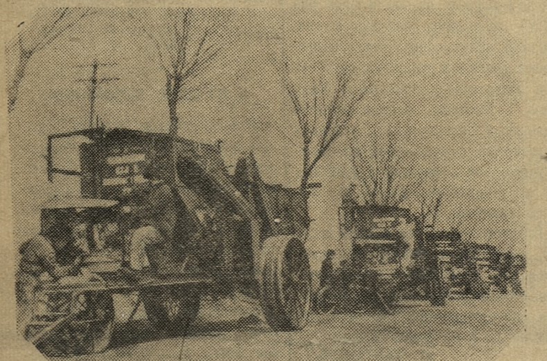
Китайская Народная Республика. Чанчуньский автомобильный завод совместно с Пекинским заводом сельскохозяйственных машин выпускает зерновые комбайны, которые прежде ввозились в Китай из-за границы. На снимке: на Пекинском заводе сельскохозяйственных машин. Подготовка комбайнов к отправке.

Второй год при Новоуткинской средней школе работает в летние каникулы лагерь. Нынешним летом он размещается в здании интерната.