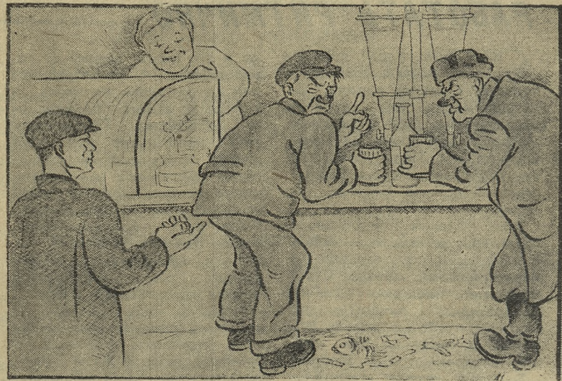
Рис. М. Скатиной.

деление, колотил всех, походя, тазом. Еле-еле его удалось связать и увезти в милицию. Случай этот был давно. Бахтин по-прежнему заслуженное наказание. Но возвращаться к этому факту приходится: до сих пор в бани Первоуральска пропускают лю-