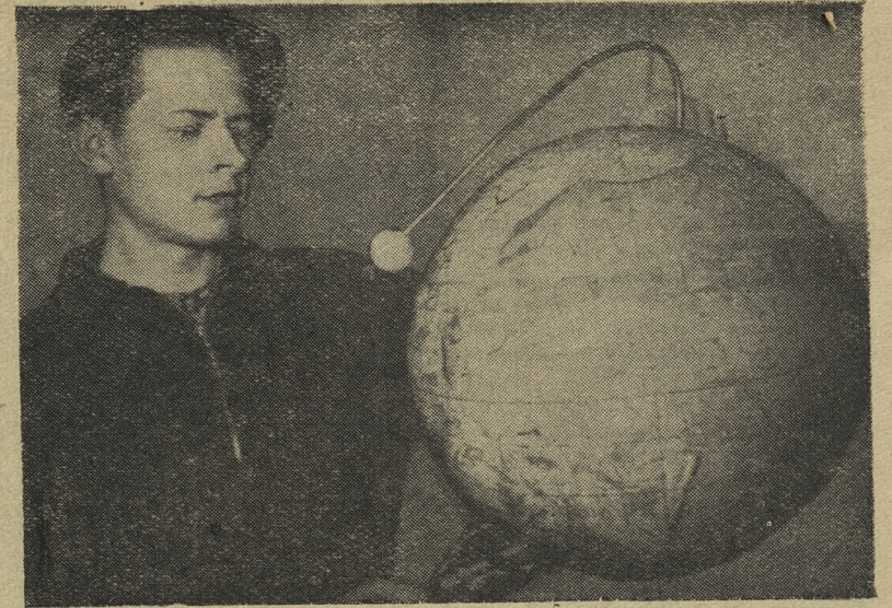
Недавно в городе проходила выставка технического творчества учащихся, в которой приняли участие и ученики школы № 2.